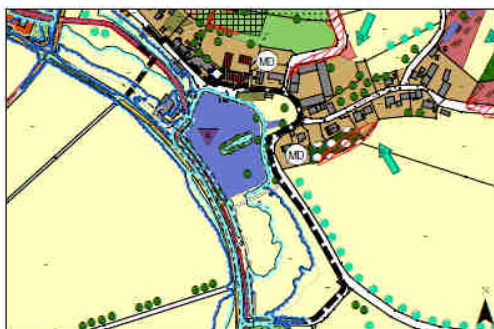
Ausschnitt FNP/LP – Bestand

Im Zuge dieses Bauleitplanverfahrens wird der rechtswirksame Flächennutzungsplan (FNP) mit Landschaftsplan (LP) durch die Aufstellung des Deckblattes Nr. 10 im Parallelverfahren geändert und auf die angestrebte Gesamtentwicklung abgestimmt. Die Ausweisung erfolgt als Sondergebiet und als Fläche für Versorgungsanlagen. Flächen mit bereits vorhandener Bebauung innerhalb des Änderungsbereiches werden dem Charakter entsprechend als Dorfgebiet dargestellt.