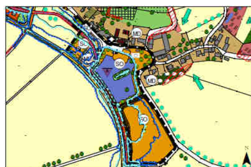
Ausschnitt FNP/LP – Fortschreibung D10

Quelle: Rechtskräftiger FNP, Gemeinde Herrngiersdorf; verändert KomPlan; Darstellung nicht maßstäblich.