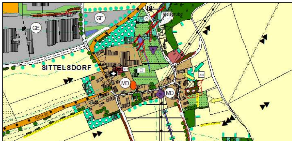
FNP Herrngiersdorf –Bereich Ortsteil Sittelsdorf

Die Gemeinde Herrngiersdorf besitzt einen rechtswirksamen Flächennutzungsplan aus dem Jahr 1992 sowie einen Landschaftsplan aus dem Jahr 2001. Der Geltungsbereich der vorliegenden Klarstellungs- und Ergänzungssatzung ist darin größtenteils als Dorfgebiet MD festgesetzt.